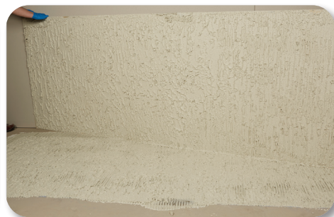
Transfert supérieur - pleine couverture avec un minimum d'effort