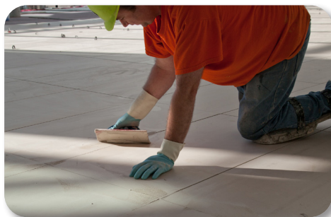
Temps ouvert prolongé / Jointoiment après 6 heures